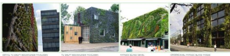
Figuur: Voorbeeld van een natuurlijke oplossing

Vergroening biedt mogelijk antwoorden op uitdagingen waar Brabantse steden mee worstelen als: het veranderende klimaat, het teruglopen van de biodiversiteit, de energietransitie en een slechte luchtkwaliteit. Allen urgente maatschappelijke problemen die dringend opgelost moeten worden. Waarbij het van belang is om na te gaan of je meerdere problemen tegelijkertijd kunt aanpakken. Met als voorbeeld de aanleg van een dijk tegen hoogwater, tegelijkertijd een weg, energieopslag in de dijk en bedrijfsruimte aan de binnenkant. Wat zijn de feiten bij de benoemde urgente vraagstukken, welke zijn succesvolle benaderingen of concepten om die te analyseren, welke zijn op natuur gebaseerde oplossingen en hoe voer je die in de Brabantse stedelijke